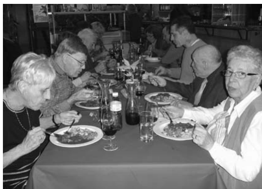
Das feine Nachtessen mundet vorzüglich.