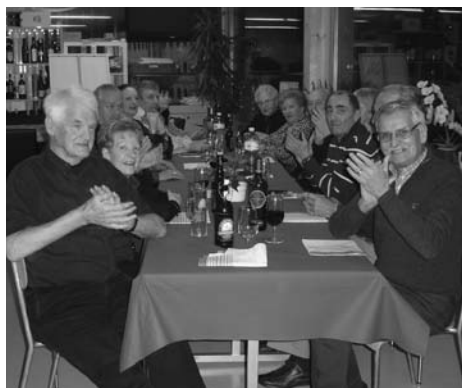
Applaus für den amüsanten Vortrag.