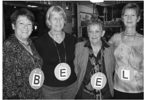
Die Damen entschieden das Spiel klar für sich.