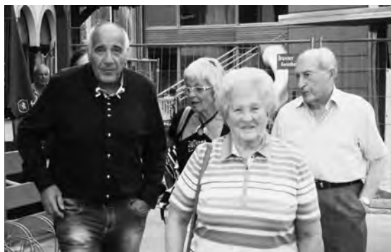
Ein erlebnisreicher und kameradschaftlich sehr wertvollen Veteranen-Ausflug geht zu Ende.