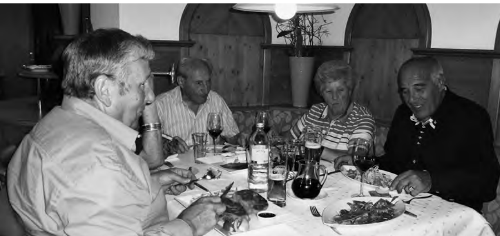
Landgasthof «Die Linde» in Höchst