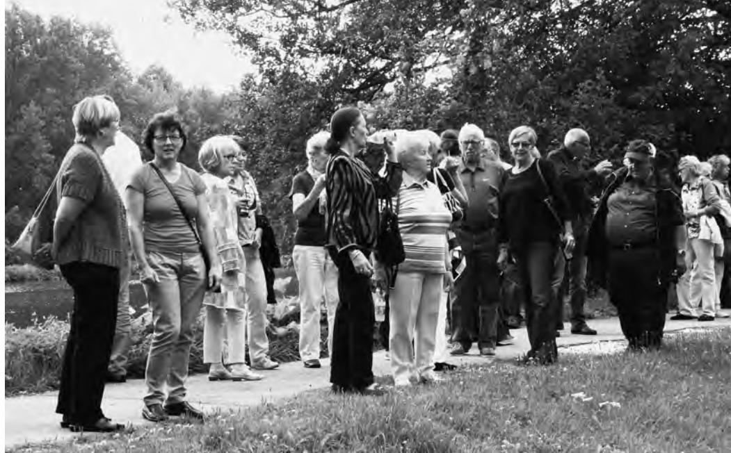
Zwischenhalt bei der Rundfahrt