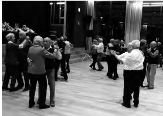
Beschwingt in den Abend