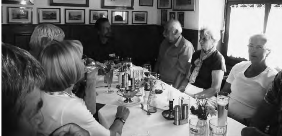
Gemütliches Ambiente, ein gutes Glas Wein ...